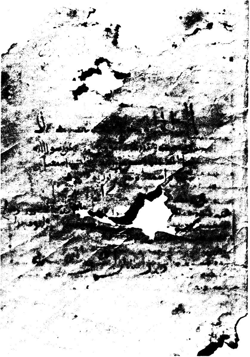
الورقة الأولى ( ق ١ أ )