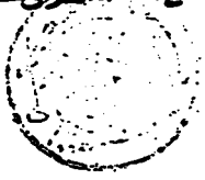
صورة الورقة الأخيرة

الحمد لله وحده والصلاة والسلام على من لا نبي بعده وأما بعد فقد ألقى هذا مبحثاً في أصول الفقه الإسلامي وهو من مقتضى ما كتبه في مبحث أصول الفقه الإسلامي وهو من مقتضى ما كتبه في مبحث أصول الفقه الإسلامي وهو من مقتضى ما كتبه في مبحث أصول الفقه الإسلامي