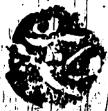
الورقة الأخيرة من نسخة دار الكتب المصرية