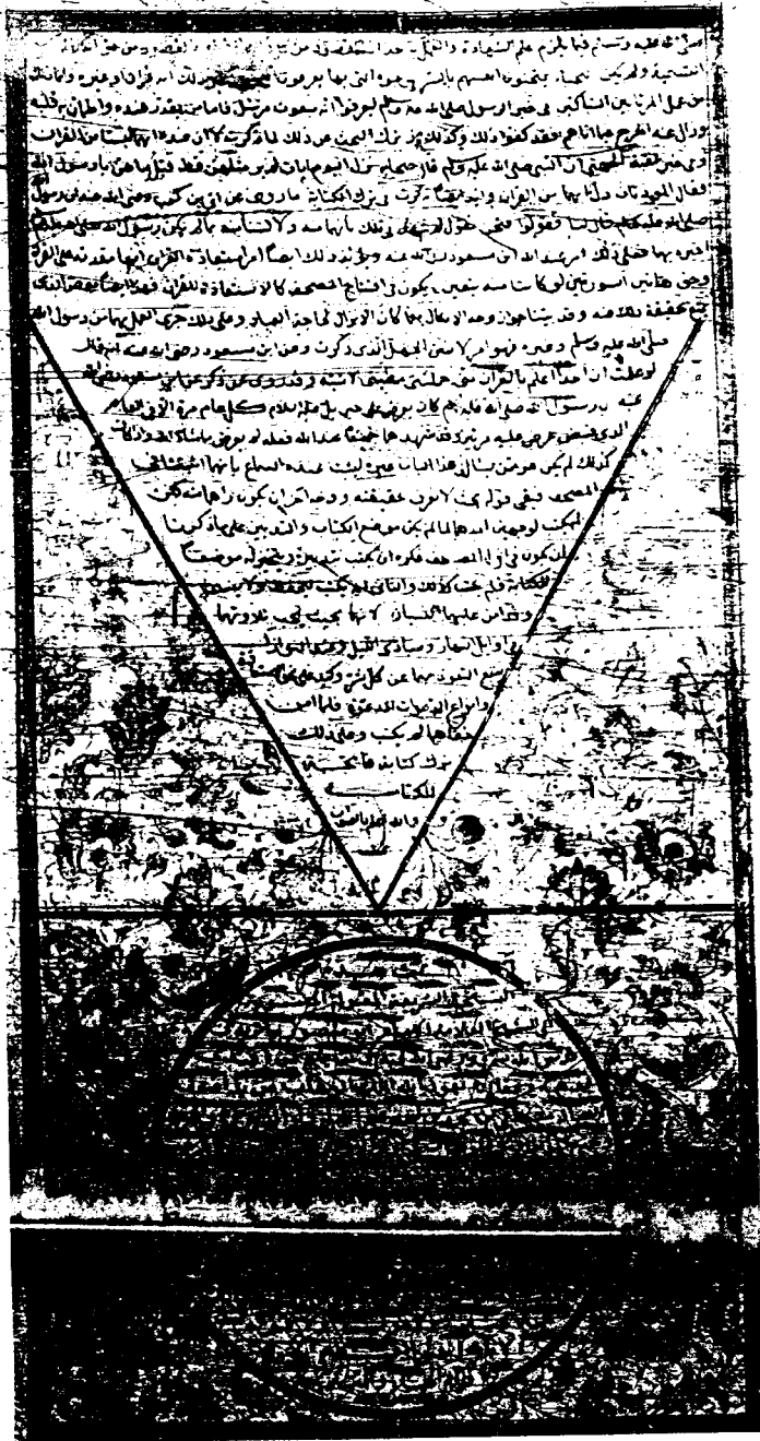
صورة الصفحة الأخيرة من نسخة دار الكتب المصرية