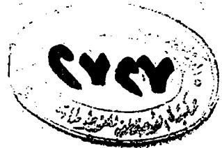
صورة الصفحة الأخيرة من الرسالة

وصلى الله على سيدنا محمد وآله وصحبه وسلم وصلى الله على محمد وآله وصحبه وسلم