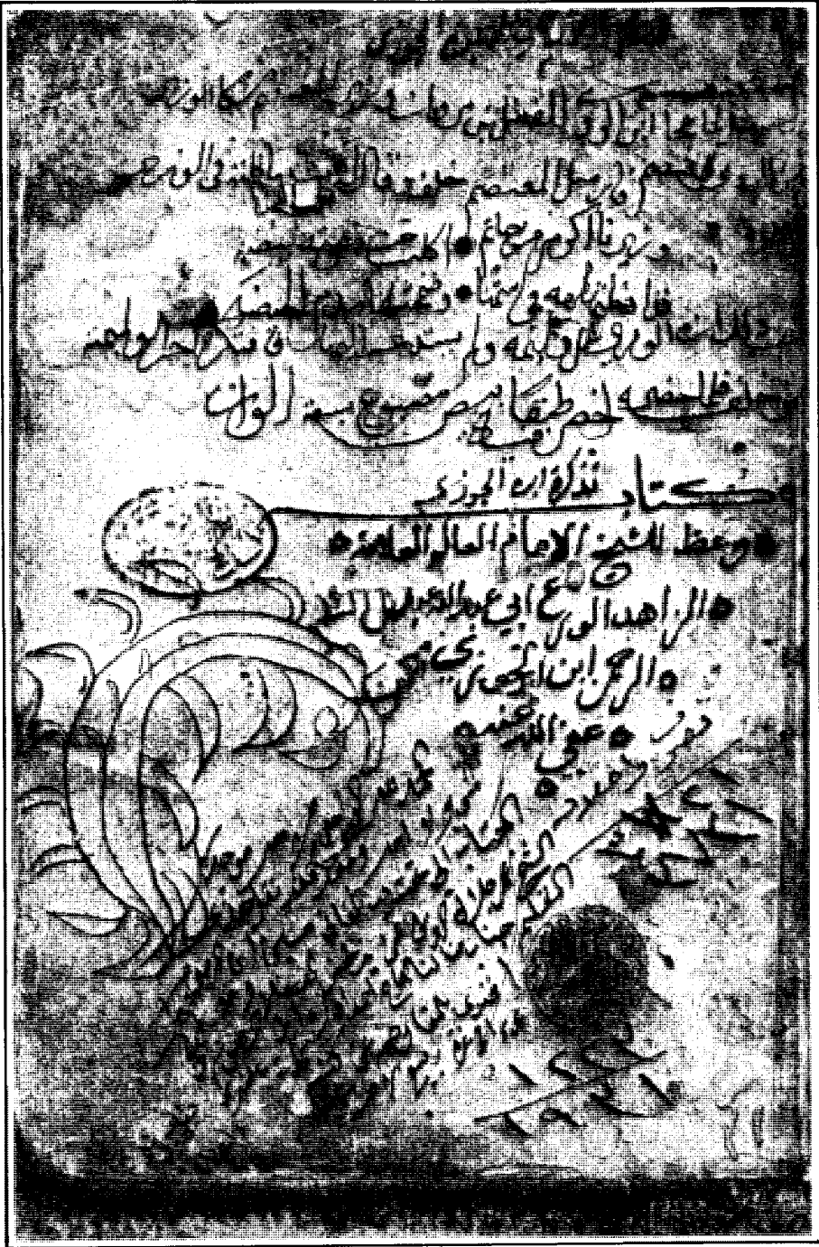
صورة لوحة العنوان للأصل الخطي