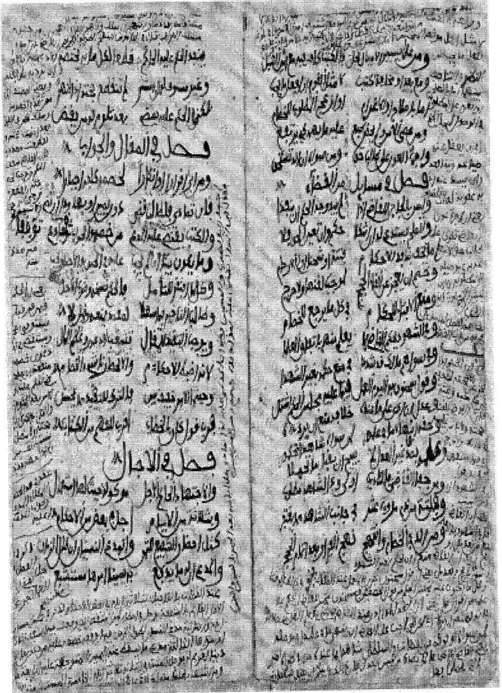
صورة الصفحة الثانية