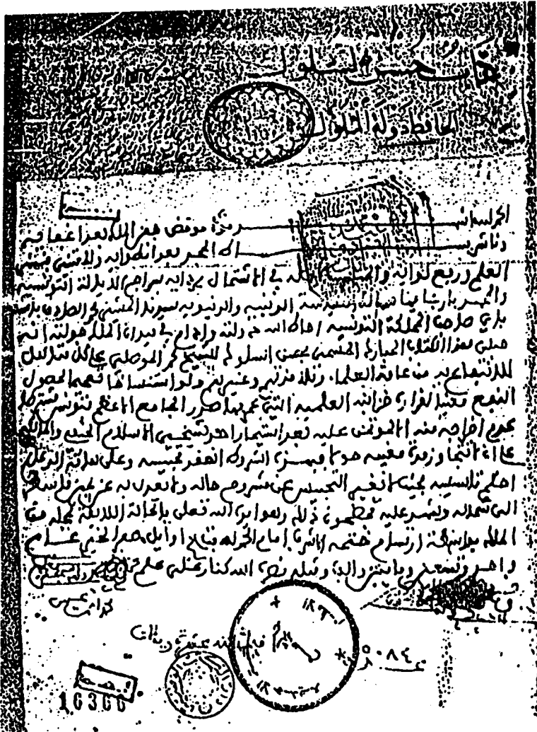
عنوان الكتاب في النسخة التونسية