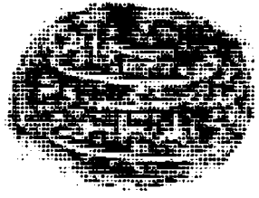
صورة الصفحة الأولى من نسخة المحمودية

وقف مدرسة محمودية بمقره بقره القدر سور بمكة المكرمة بسم الله الرحمن الرحيم