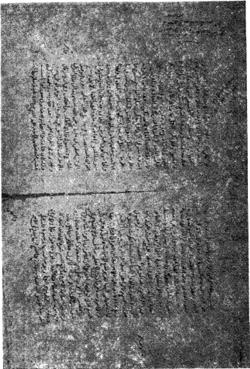
الورقة الثانية من نسخة (أ).