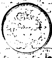
«صورة من الصفحة الأخيرة (أ)»

شجرة على الشيخ الامام العالم العلامة الفاضل ابو بصير عن ابي بصير عن ابي بصير عن ابي بصير سنة ثمان وعشرين وستمائة بمكة والفقير محمد بن ابي بصير عن ابي بصير عن ابي بصير عن ابي بصير عن ابي بصير عن ابي بصير انشاء الله تعالى