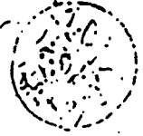
خلاف النسخة الثانية من المخطوطة (الجزء الثالث)

سمعنا في شهر ربيع الثاني من اهلهم المشيخ القريشي رضي الله عنه ونفعنا بالعلم امين رب العالمين