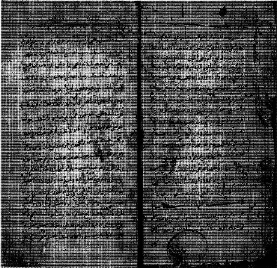
راموز الصحيفة الأولى من نسخة (م)