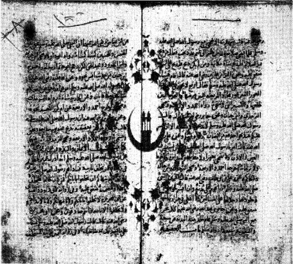
راموز الصحيفة المائة من المخطوطة (م)