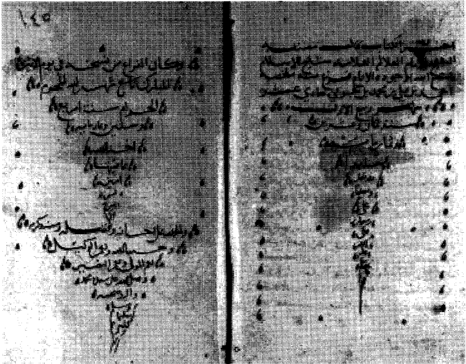
راموز الصحيفة الأخيرة من المخطوطة (ت) ويظهر من خلالها تاريخ النسخ