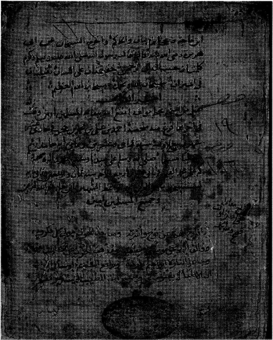
راموز الصحيفة الأخيرة من المخطوطة (م) ويظهر من خلالها بلوغ المقابلة على أصل المؤلف واسم ناسخها وتاريخ النسخ