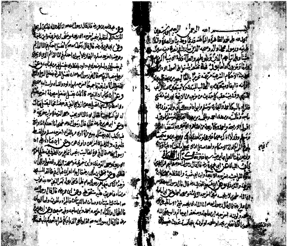
راموز الصحيفة الأولى من المخطوطة (غ)