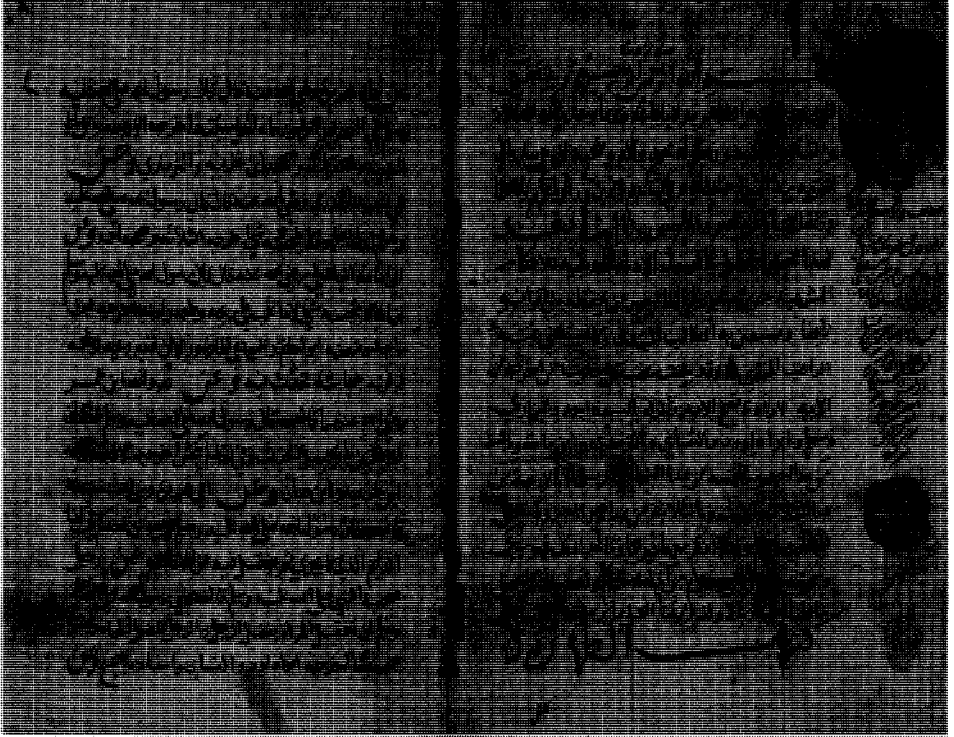
راموز الصحيفة الثانية من المخطوطة (ت)