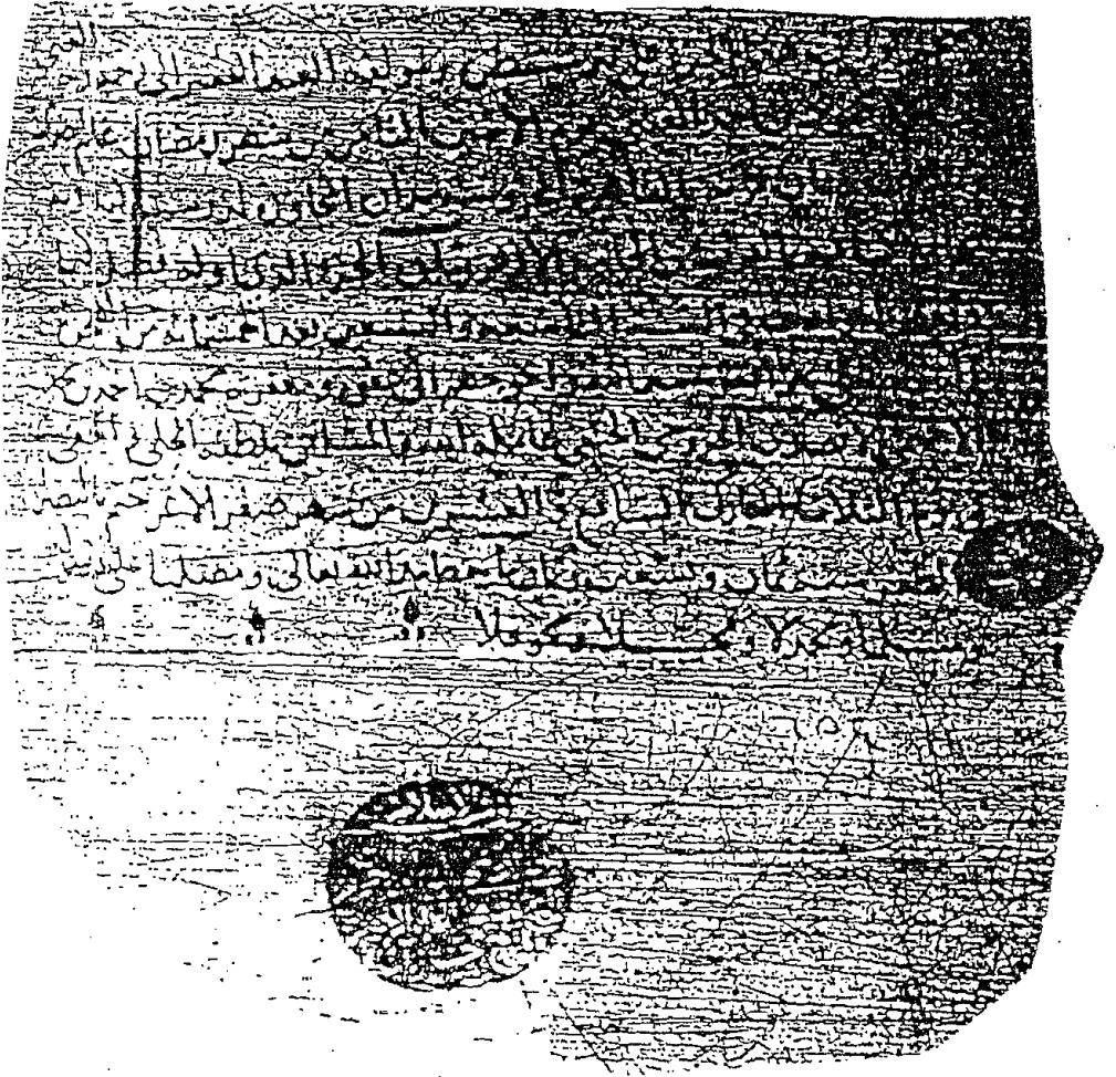
لوحة ٣ من نسخة معهد المخطوطات العربية رقم ١٩/٢٩١١ المصورة من مكتبة أحمد الثالث بتركيا .